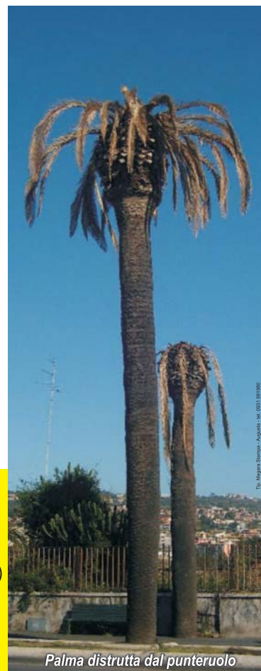
Palma distrutta dal punteruolo